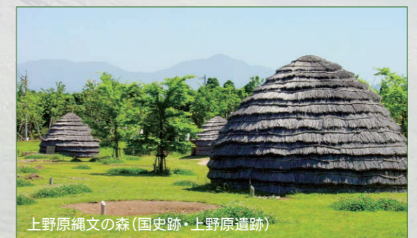
上野原縄文の森(国史跡・上野原遺跡)